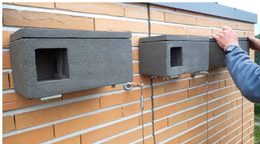
Mussennestkasten aan de centrale woonblokken van Hoeve De Laere

"We hebben dit verhaal versterkt door klimplanten aan de gevels aan te brengen en door twee plantenbakken met eetbaar, bijvriendelijk groen tussen de appartementen te plaatsen. De bewoners zullen die bakken zelf onderhouden, zo willen we het sociaal contact stimuleren."