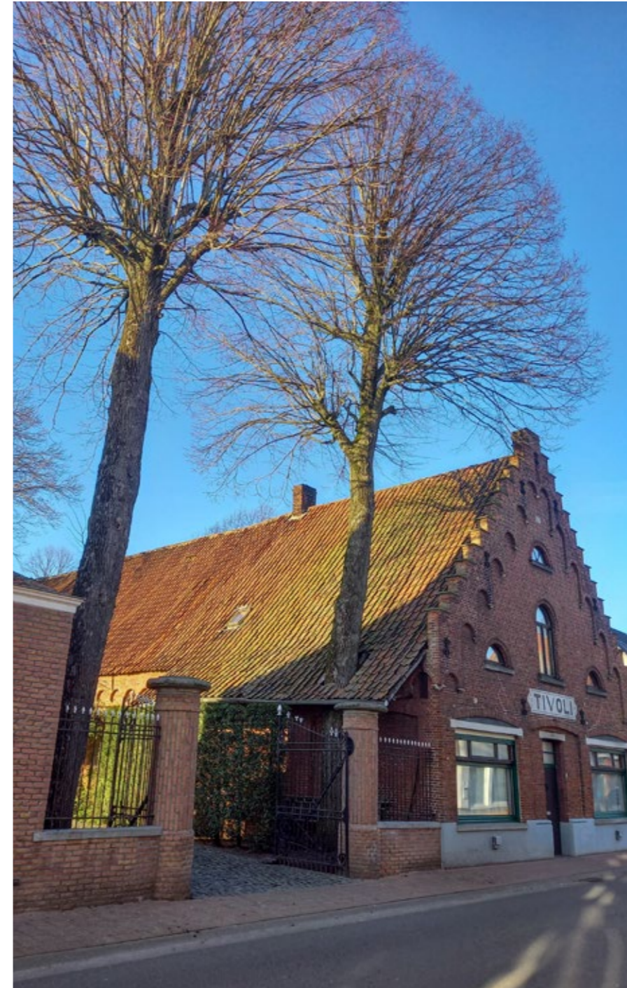
Welkomstlinden aan de ingang van de vroegere brouwerij Tivoli te Beernem

In het voorjaar van 2021 gaan het Regionaal Landschap Houtland en de Intergemeentelijke Onroerende Erfgoedinstellingen Raakvlak en Polderrand op zoek naar markante bomen en struiken. In tien gemeenten brengen ze in kaart welke bomen