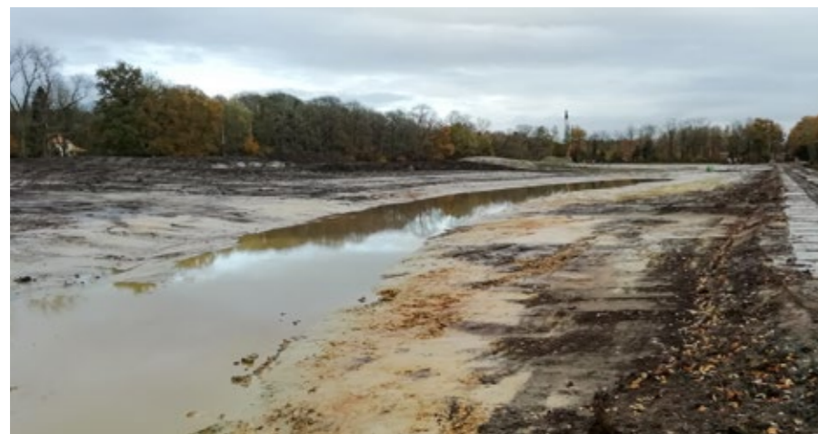
De natuurlijke overstromingszone zal een kwart van een hectare open water bevatten. Ernaast ligt een moeraszone.

Contact: frank.debeil@vlm.be, tel. 050 45 81 58