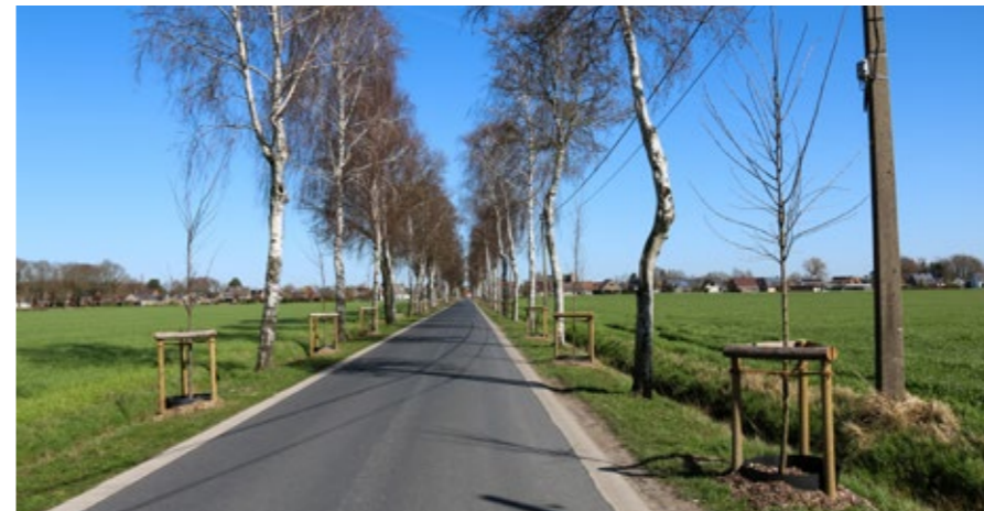
Tussenaanplant van Fladderiep in de Steenveldstraat

De afgelopen jaren maakten het pijnlijk duidelijk: de klimaatverandering eist z'n tol. Droge zomers volgen elkaar op en dwingen ons tot een duurzaam beheer van water en bomen. Die strijd tegen de klimaatopwarming wordt ook gevoerd in Torhout.