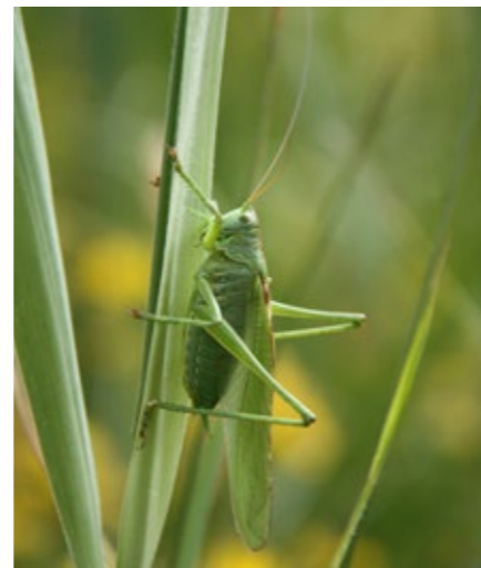
De Grote Groene Sabelsprinkhaan voedt zich met insecten die op planten leven

Lijkt dit jou toch een grote stap? Kijk dan even hoe jouw gemeente het voorbeeld toont. Alle gemeenten uit het Houtland nemen namelijk deel aan het bijenproject 'Kruisbestuivers' en beheren hun openbaar domein voortaan meer en meer op een bijvriendelijke manier.