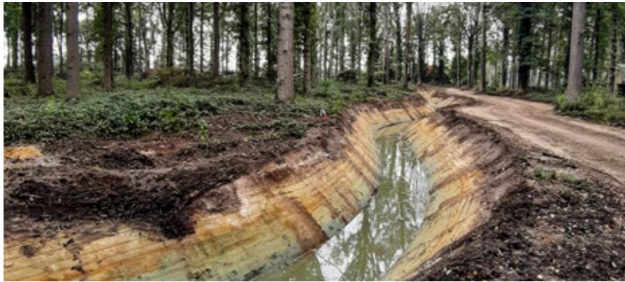
De kronkelende loop van de nieuwe Blauwhuisbeek met ecologisch beekprofiel en beheerpad

De Vlaamse Landmaatschappij (VLM) stond in voor de aankoop van 33 ha bos, heide en dreven ten zuiden van de woonwijk, het huidige ANB-domein Blauwhuisbossen. Daar heeft de VLM in het kader van het landinrichtingsplan Wildenburg-Aanwijs een nieuwe beekloop (540 m) aangelegd om het